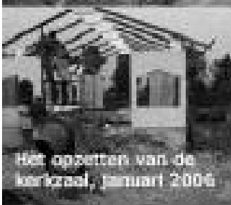
Het opzetten van de kerktoren, januari 2006