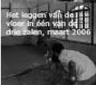
Het leggen van de vloer in één van de drie zalen, maart 2006