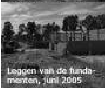
Leggen van de fundamenteën, juni 2005