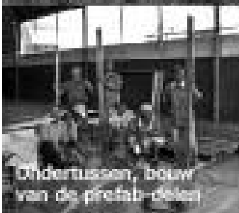
Ondertussen, bouw van de prefab-delen