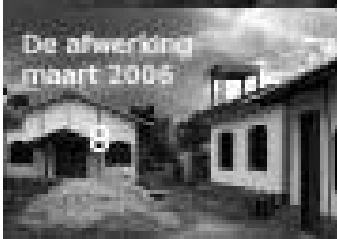
De afwerking maart 2006