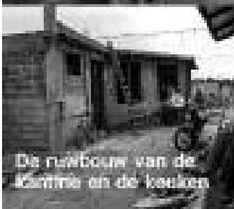
De nabouw van de keuken en de badkamer