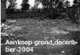
Aankoop grond, december 2004

Dat is wat we met de PEPE/MISSÃO da Lagoa willen zijn. Een ark die vaart op de zwaar vervuilde moerasmeren van de rivier de Tietê in São Paulo. Wilt u ook zo'n kerk? Dat kan. Er zijn nog een heleboel kinderen die wachten op een leerplek in deze nieuwe PEPE. Een aanmeldingsformulier vindt u achter in dit boekje of op onze website.